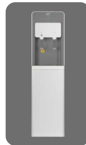
Прямоточный обратный осмос